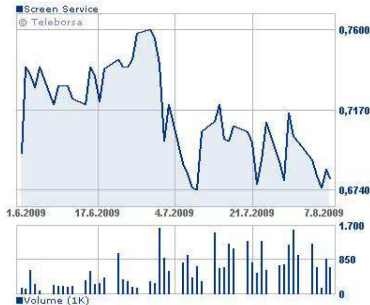
ILLUSTRAZIONE DEI FATTI DI RILIEVO DELL'ESERCIZIO IN CORSO

Tra i vari obiettivi commerciali ed industriali raggiunti, si evidenziano in particolare i seguenti: