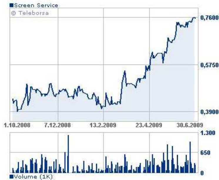
Grafico andamento azioni Screen Service dal 1 ottobre 2008 al 30 giugno 2009.

Il 7 agosto 2009 la quotazione è stata pari ad Euro 0,68