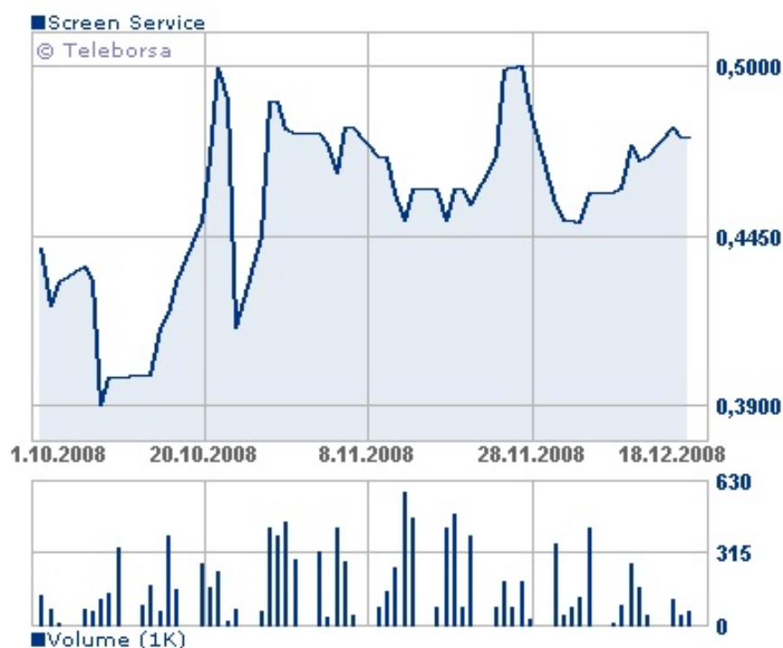
Grafico andamento azioni Screen Service dal 1 ottobre 2008 al 31 dicembre 2008

Il 30 dicembre 2008 (ultimo giorno di negoziazione dell'anno) la quotazione è stata pari ad Euro 0,44.